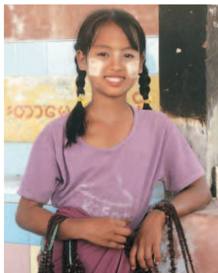
Mädchen mit einem Lächeln und Thangka-Make-up im Gesicht.