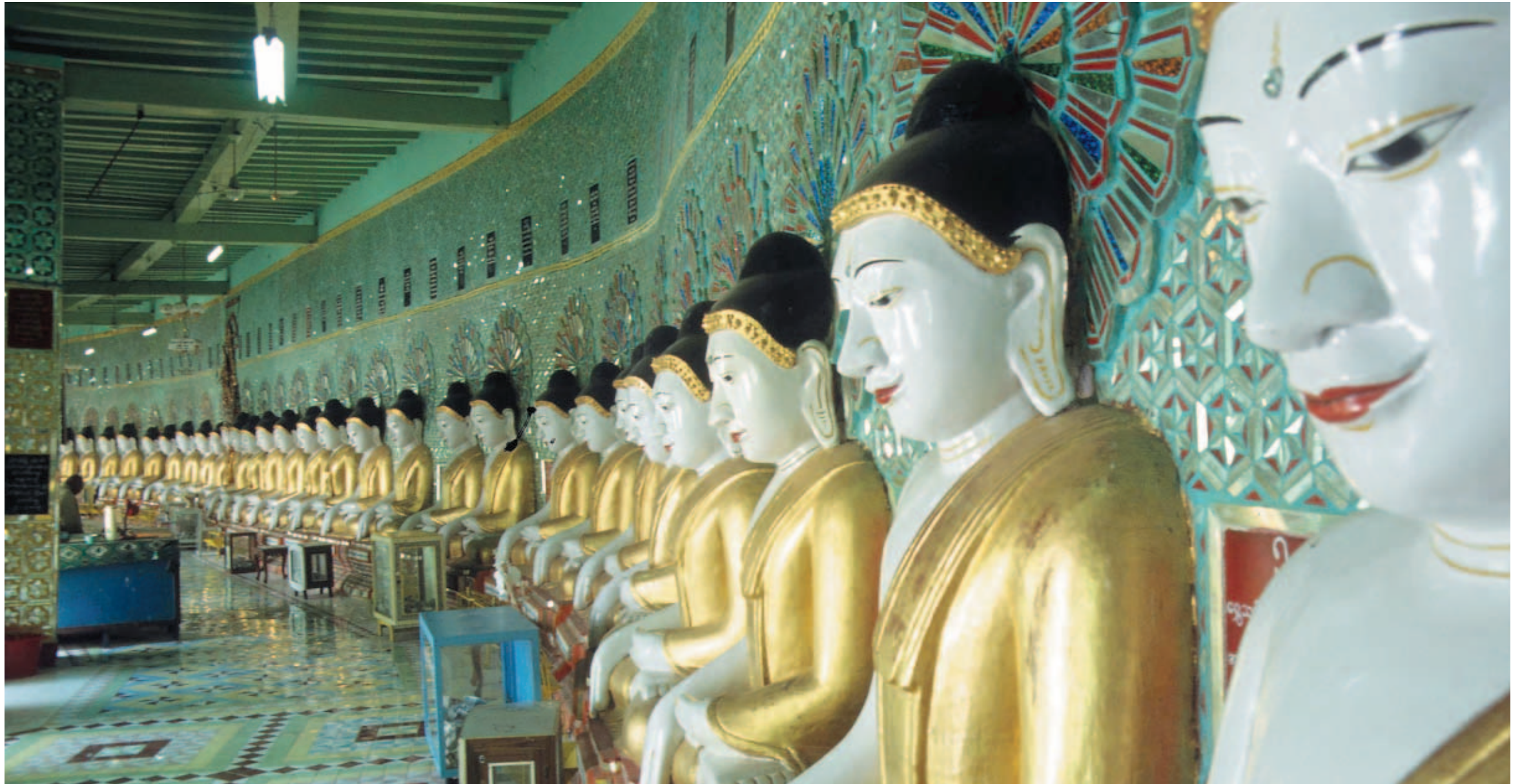
Das Land der goldenen Buddhas: 45 von ihnen sind in der berühmten Umin-Thounzeh-Pagode in Sagaing zu sehen.

Nach fast sechsjähriger Bauzeit ist Anfang Juni der mit 6,3 Kilometern längste Straßentunnel Südasiens für den Verkehr freigegeben worden. 750 Kilometer südlich der Hauptstadt Hanoi und 950 Kilometer nördlich der Wirtschaftsmetropole Ho-Chi-Minh-City gelegen, unterquert das 200 Millionen US-Dollar teure Verkehrsprojekt das wichtigste Nadelöhr von Vietnam Nord-Süd-Verbindung (Nationalstraße 1) – den legendären „Pass der Meereswolken“. Das erspart zum Beispiel bei einer Autofahrt zwischen dem Küstenort Da Nang und der alten Kaiserstadt Hue eine Fahrzeit von rund einer Stunde. Für Pkws kostet die Passage durch den Tunnel 1,60 US-Dollar. Auf eigenen Wunsch werden Touristen allerdings auch weiterhin die historische, rund 20 Kilometer lange Serpentin-Strecke über das bis zu 1172 Meter hohe Truong-Son-Gebirge benutzen dürfen, um die faszinierenden Ausblicke auf die Meeresküste zu genießen.