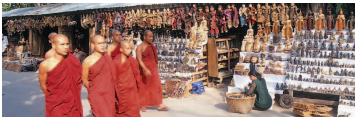
Allgegenwärtig in Myanmar – Mönche in traditionellen Gewändern.

Anreise: Die Einreise nach Myanmar erfolgt meist über die internationalen Flughäfen Yangon oder Mandalay, die vor allem von Bangkok aus angefliegen werden. Rückflug-Tickets von Frankfurt/Main über Singapur (mehrtägiger Stoppover möglich) nach Bangkok kosten mit Singapore Airlines rund 750 Euro (plus Steuern und Zuschläge); inklusive Anschluss-Flug nach Yangon rund 890 Euro. Thai Airways fliegt für 700 Euro beziehungsweise 925 Euro. Geld: Der Zwangsverwerb von 200 Foreign Exchange Certificates (FEC) wurde abgeschafft, während der Euro dabei ist, den US-Dollar als wichtigste Schwarzmarkt-Währung abzulösen. Offizielle Landeswährung ist der Kyat – gesprochen Dschat. Doch sollten besser stets Devisen (am besten in kleinen Scheinen) mitgeführt werden.