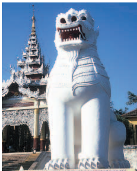
Löwen-Wache am Treppenaufgang zum 236 Meter hohen Mandalay Hill.