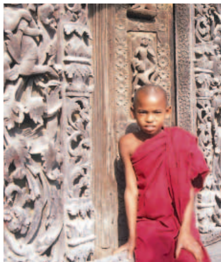
Fotogener kleiner Mönch vor großer Schnitzkunst.